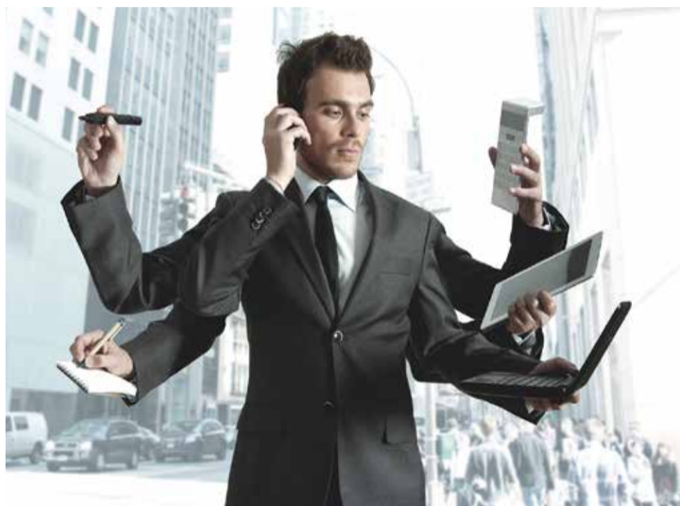
Stress, Termindruck und Überlastung am Arbeitsplatz führen häufig zu gesundheitlichen Problemen.

Je höher der Stresspegel, desto schwerer fällt dabei das Abschalten nach der Arbeit. Dies hat zur Folge, dass wichtige Regenerationsphasen für Körper und Seele zu kurz kommen. Und das Abschalten ist für vieles der Schlüssel. Denn von den Menschen, die keine echten Auszeiten finden, ist jeder Zweite ausgebrannt. Gestresste