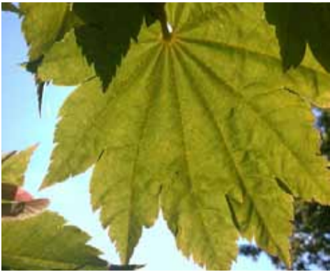
Charakteristisch für den Ahornbaum ist die jedem bekannte Ahorn-Blattform.

Das Ahornholz gilt als sehr warmes, wenn auch nicht so starkes Holz. Im Winter vermittelt ein in der Hand gehaltenes Stück Ahornholz ein Gefühl von Wärme; Buchenholz dagegen kühlt stark. Aus diesem Grund werden noch heute Stöcke für Arbeitsgeräte oft aus Ahornholz gefertigt, obwohl dies nicht so hart ist wie beispielsweise Buche.