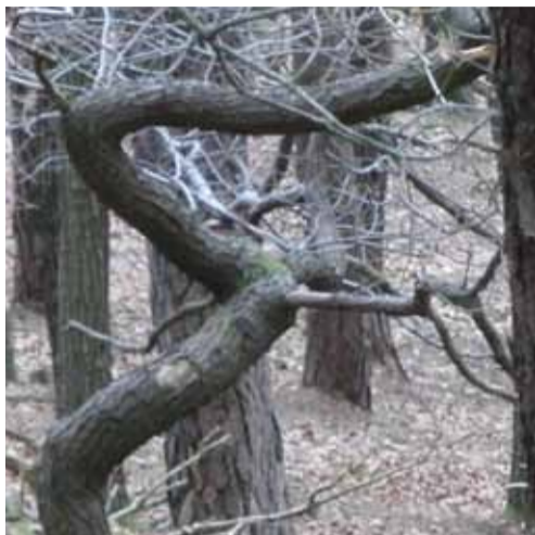
Das Pflanzenwachstum ist durch Störzonen oftmals negativ beeinflusst. Es entstehen Fehlbildungen.

Auch hierzulande ist im Zusammenhang mit terrestrischer Strahlung aus früheren Zeiten eine Methode der Baugrunduntersuchung überliefert, wonach vor Baubeginn am Ort des späteren