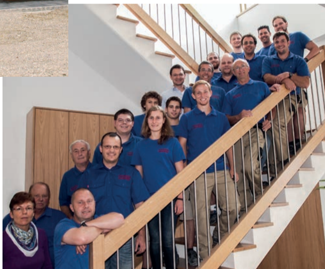
Die fachkundig geschulten Mitarbeiter der Schreinerei Ganslmeier, die sich mit Wissen und Erfahrung miteinbringen, tragen dazu bei, die Qualität ständig weiter zu optimieren.

Wenn man pausenlos den negativen Umwelt- und Strahlenbelastungen ausgesetzt ist (und das betrifft wirklich jeden!), dann wird dem Körper Energie entzogen – wir können nicht mehr „runterfahren“ und kommen nicht mehr ins natürliche Gleichgewicht. In meinem Privathaus nutze ich „me-