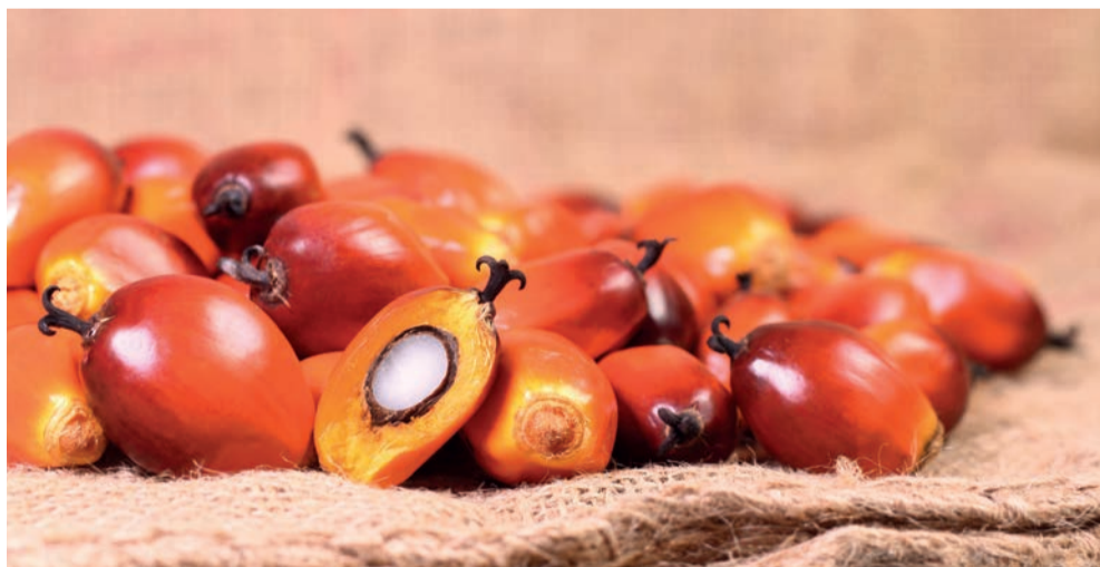
Aus den Kernen der Palmen wird das Palmöl gewonnen. Im Jahr 2011 wurden 54 Millionen Tonnen produziert.

Kennen Sie Palmöl? Nein? Wir können Sie beruhigen: Sicher haben Sie schon Produkte mit Palmöl gekauft und diese auch gegessen oder verwendet. Denn, in fast jedem zweiten Produkt des Alltags ist Palmöl enthalten. Der Löwenteil findet sich in Lebensmitteln wieder: In Keksen, Fertigsuppen, Eiscreme, Schokoriegel und Fritierfett. Der geringe Rohstoffpreis macht das Palmöl für die Nahrungsmittel-Industrie so interessant. Aber, der massive Eingriff in die Natur zerstört die Regenwälder der Erde.