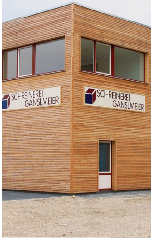
Schreinerei Ganslmeier, Albaching Zertifiziert durch Johann Mayer

mon“ nun schon seit vier Jahren und bin überzeugt davon.