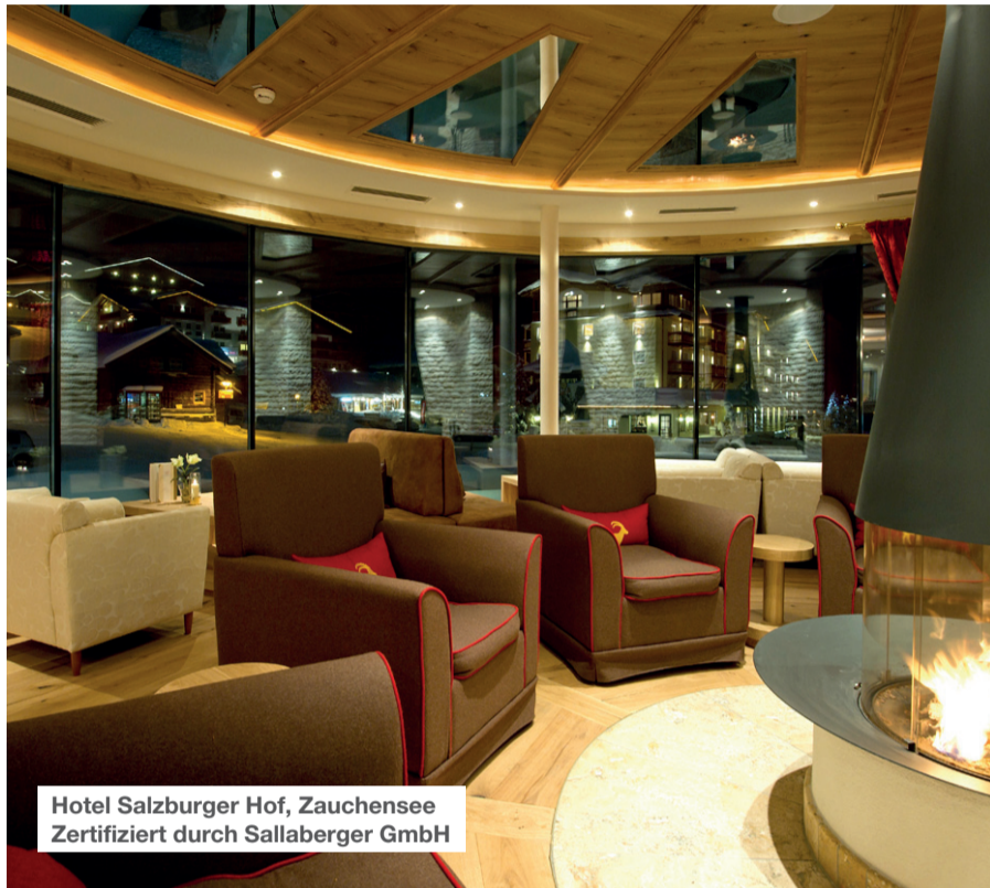
Hotel Salzburger Hof, Zauchensee Zertifiziert durch Sallaberger GmbH

„Ein wunderbarer Urlaub“, „Sehr empfehlenswert“, „Ein unvergessliches Erlebnis“ – das sind Aussagen von Gästen, die ihren Urlaub im Salzburger Hof in Zauchensee verbracht haben. Mitten in der beeindruckenden Bergwelt Österreichs liegt das 4-Sterne-Superior Hotel im Herzen des Salzburger Landes.